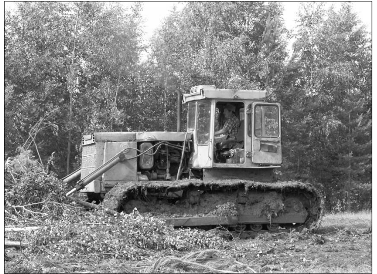
В работе бульдозерист А.А. Сажин.

На втором, заключительном этапе надо будет устранить причинённый природой почве вред. Например, мы воочию убедились, что отдельные уча-